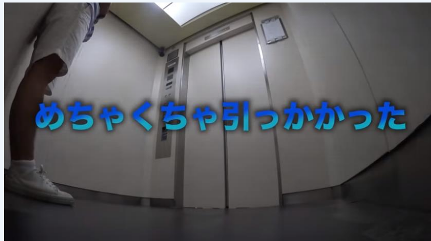
水溜りボンド YouTubeチャンネル 【超危険】エレベーターの床ないドッキリがヤバすぎたww より